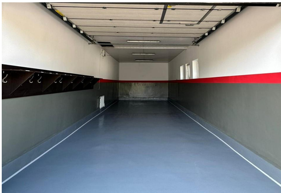
Garaż OSP Treblinka po remoncie.

W ramach złożonego wniosku o przyznanie pomocy finansowej ze środków województwa mazowieckiego na zadanie „OSP-2023” Gmina Małkinia Górna otrzymała dotację celową na zakup wyposażenia dla jednostek Ochotniczych Straży Pożarnych z przeznaczeniem na zakup 24 kompletów ubrań specjalnych strażackich oraz na zakup torby medycznej PSP R1 z tlenoterapią i szynami. Zakupione komplety ubrań specjalnych strażackich trafiły do: 8 kompletów dla OSP Prostyń, 5 kompletów dla OSP Zawisty Podleśne, 4 komplety dla OSP Daniłówka Pierwsza, 3 komplety dla OSP Kańkowo, 2 komplety dla OSP Treblinka i 2 komplety dla OSP Małkinia Górna. Torba medyczna PSP R1 z tlenoterapią i szynami Kramera została przekazana jednostce Ochotniczej Straży Pożarnej w Grądach. Wkład własny Gminy Małkinia Górna w wysokości 39 650 zł, pomoc finansowa od Województwa w formie dotacji celowej w wysokości 39 650 zł.