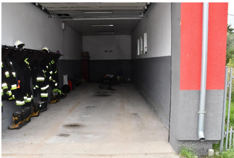
Garaż OSP Treblinka przed remontem.

W ramach złożonego wniosku o przyznanie pomocy finansowej ze środków województwa mazowieckiego na zadanie „MAZOWIECKIE STRAŻNICE OSP-2023” Gmina Małkinia Górna otrzymała dotację celową ze środków województwa mazowieckiego na zadanie „MAZOWIECKIE STRAŻNICE OSP-2023” z przeznaczeniem na remont budynku Ochotniczej Straży Pożarnej w Treblince w zakresie: posadzki i ścian w garażu. Zadanie jest współfinansowane ze środków otrzymanych od Samorządu Województwa Mazowieckiego. Kwota dofinansowania 12 500,00 zł. Wkład własny z budżetu gminy w wysokości 2 920,00 zł. Całkowity koszt zadania 15 420,00 zł.