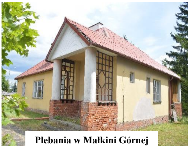
Plebania w Małkini Górnej