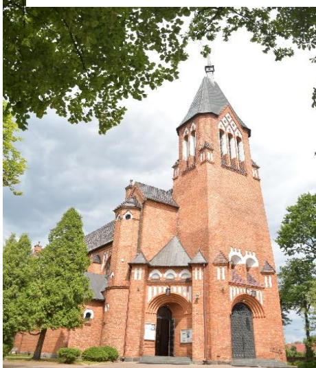
Kościół parafialny pw. Najświętszego Serca Jezusowego