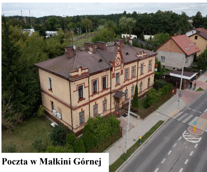
Poczta w Malkini Górnej