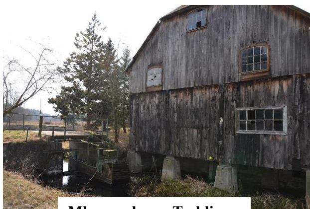
Młyn wodny w Treblince